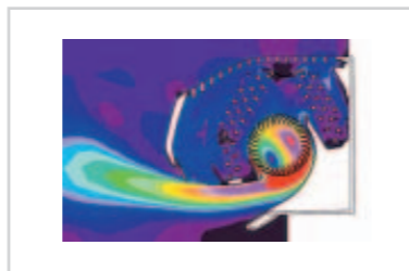
Portata dell'aria maggiore.

Verticale in modalità pompa di calore e orizzontale a freddo, generando un ambiente comodo e senza disturbare l'utente con possibili correnti d'aria dirette.