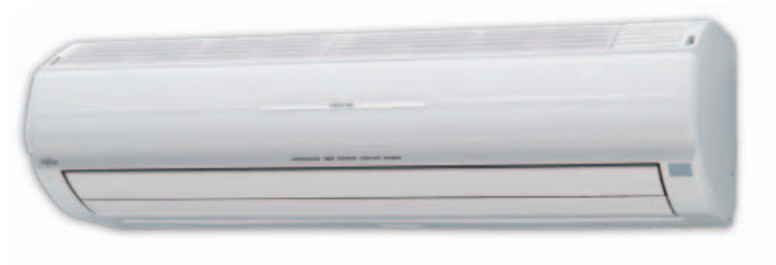
AWY 14-18 Ui A

Alta efficienza del funzionamento con un COP fino a 4,44 e maggiore flessibilità di applicazione per la riduzione delle dimensioni, con un'altezza di soli 25 cm.