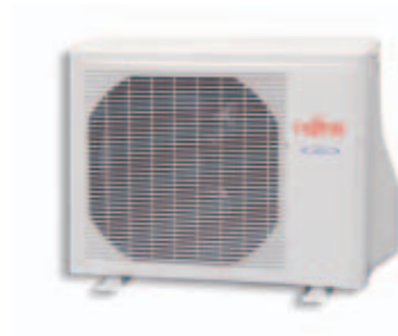
AWY 14-18 Ui A