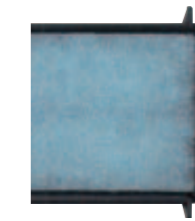
Filtro deodorante agli ioni

Gli apparecchi a parete della gamma Multisplit Inverter hanno di serie un filtro deodorante agli ioni per eliminare la sporcizia ed i cattivi odori. Dispongono anche di un filtro antibatterico che assorbe la polvere, le spore ed altri organismi pericolosi per la salute.