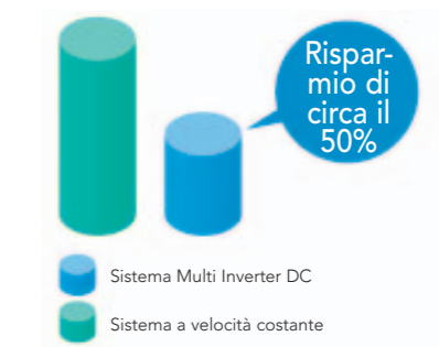
Risparmio energetico in un anno

La tecnologia Inverter sopprime i picchi durante l'avviamento del compressore modulando il numero di giri. In tal modo si ottiene un risparmio energetico fino al 50% superiore rispetto ai modelli convenzionali.